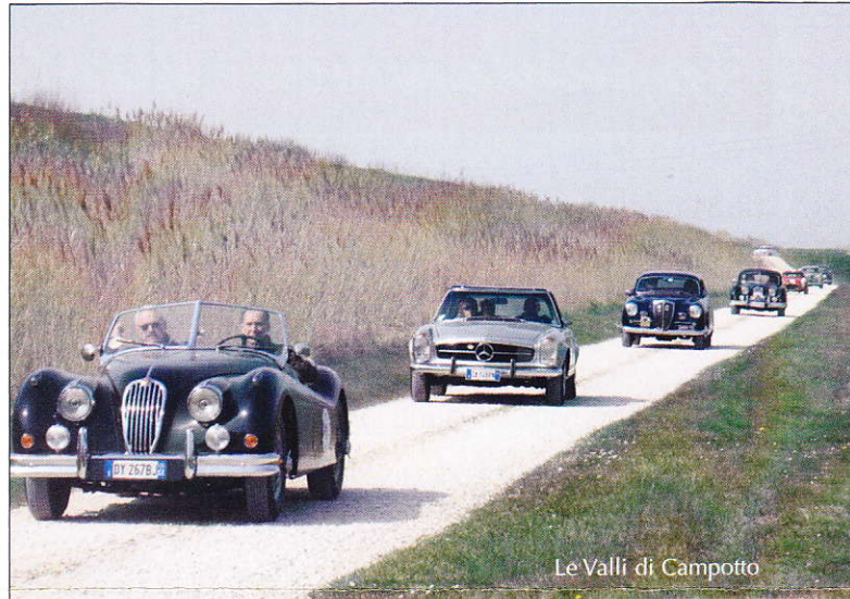
Le Valli di Campotto

La 22 a edizione ha conquistato ancora Ferrara e i partecipanti alla pluri-premiata manifestazione. Una sessantina gli equipaggi, che a bordo di auto costruite tra il 1927 al 1970, hanno percorso strade di grande significato ambientale e paesaggistico. Come, e forse più delle precedenti edizioni, l'itinerario ha affascinato letteralmente gli equipaggi, dando a loro emozioni là dove l'acqua e la terra si intrecciano e si confondono, in una sorta di estasi contemplativa, accresciuta dal piacere della guida. La visita alla Valle Bertuzzi, che rappresenta una delle aree umide più suggestive del Parco del Delta del Po, quella all'Oasi di Canneviè, unico specchio d'acqua escluso dagli interventi di bonifica, l'antico corso del fiume Volano, l'Oasi di Campotto sono stati i tratti salienti della due-giorni ferrarese. Difficile rendere il tutto in poche righe e con un'immagine: confidiamo nei resoconti a firma dei giornalisti al seguito della manifestazione, che appariranno prossimamente sulle riviste specializzate La