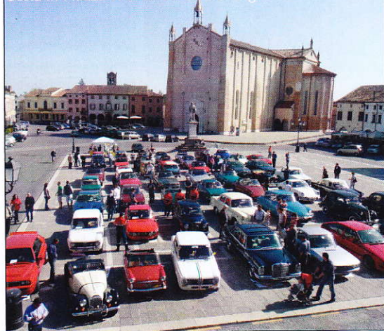
Sosta in Piazza V. Emanuele a Montagnana