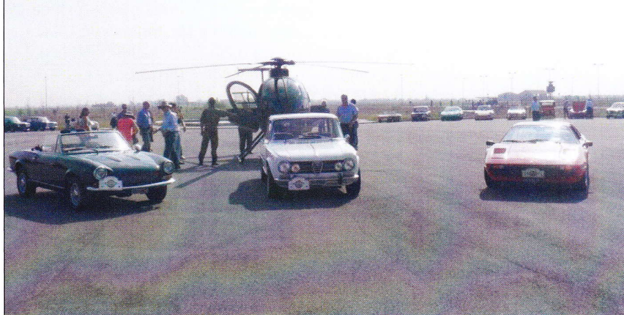
Base NATO: connubio cielo-terra