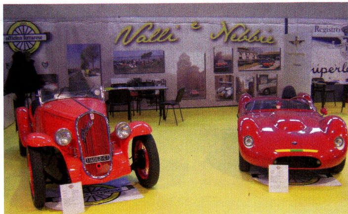
Lo stand Officina Ferrarese di una passata edizione

E' il salone internazionale delle automobili e delle motociclette d'epoca più importante d'Italia, e tra i maggiori a livello europeo, a cui parteciperanno ricambisti provenienti da tutta Europa, club e registri di marca, ma soprattutto collezionisti ed appassionati del settore. La costante presenza del nostro club, con uno stand sempre rappresentativo della nostra tradizione, ha significato nel corso degli anni la realizzazione di un esteso network con gli appassionati ed i club di numerose provincie italiane e di alcune paesi esteri, valorizzando e dando visibilità al nostro sodalizio. Quest'anno il nostro stand ospiterà alcune vetture Maserati per celebrare il centesimo anniversario della nascita della storica casa automobilistica del Tridente. Un caloroso invito ai nostri soci a partecipare