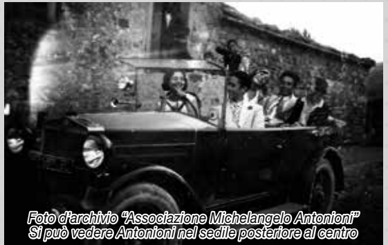
Si può vedere Antonioni nel sedile posteriore al centro

La mostra “Note a margine. Di e su Michelangelo Antonioni” , presenta opere pittoriche inedite di Michelangelo Antonioni, omaggi di artisti italiani e stranieri e locandine di alcuni suoi film. Curatrice della mostra la nipote Elisabetta Antonioni, Presidente dell’Associazione Michelangelo Antonioni; l’allestimento nell’ambito del Ferrara Film Festival, dal 22 al 26 marzo presso il Palazzo della Racchetta.