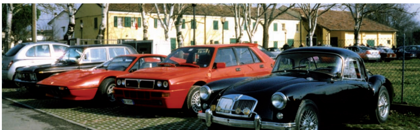
Museo della Bonifica di Ostellato