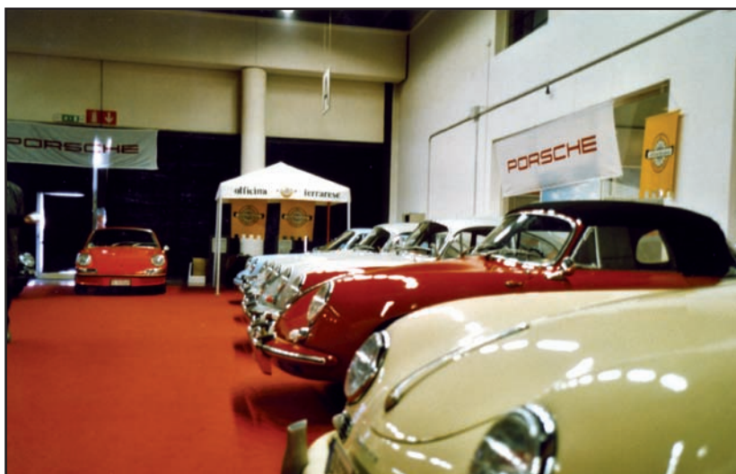
Parata delle 356 allo stand del Club, sullo sfondo una 911

Una conferma che il nostro Club ha una immagine consolidata e costituisce un sicuro punto di riferimento per gli amanti del motorismo storico.